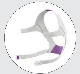
Arnés de la serie AirFit N20 for Her con broches de arnés 63558 (P)