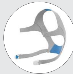
Arnés de la serie AirFit N20 con broches de arnés 63560 (P) 63561 (Est.) 63562 (G)